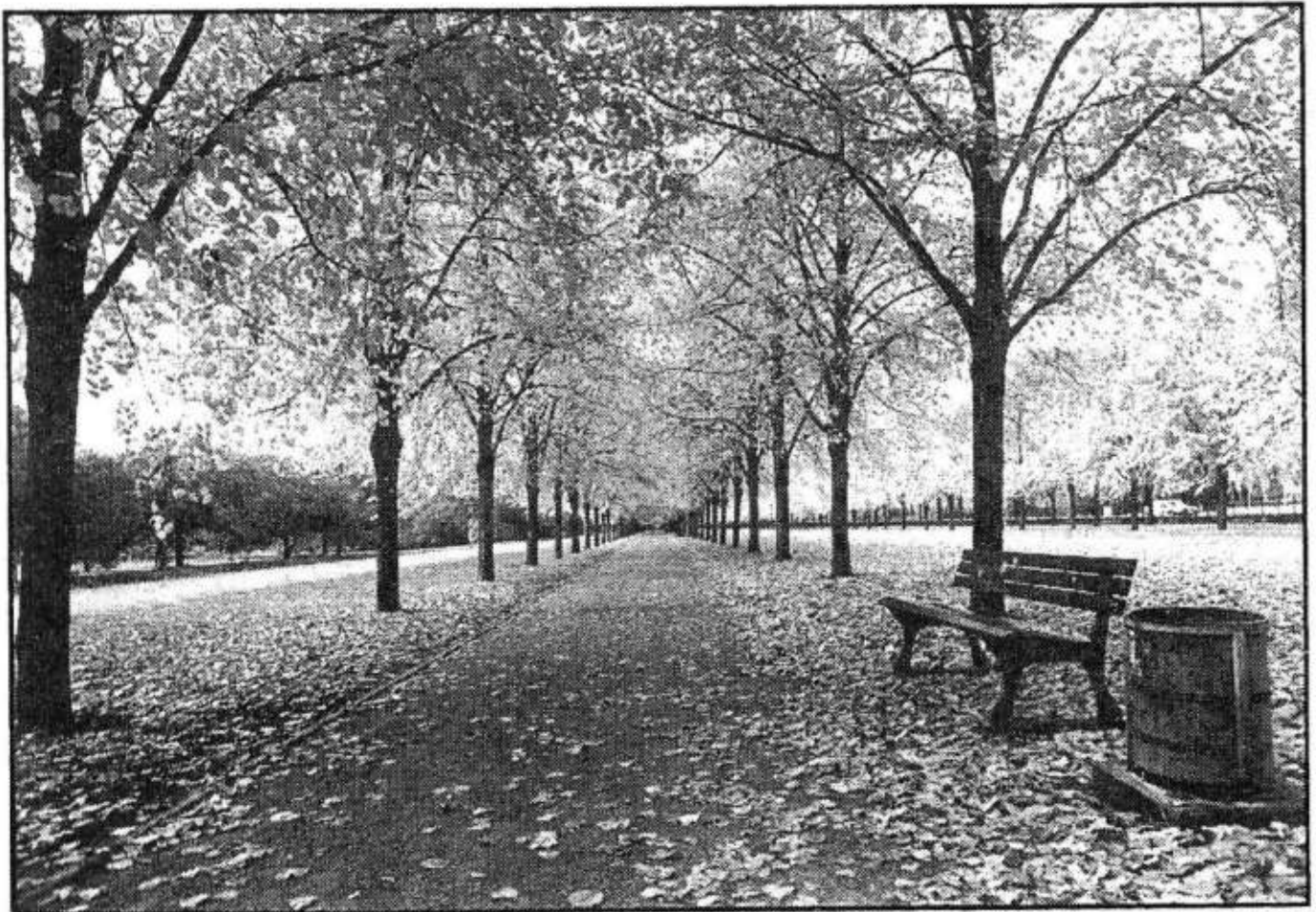
Herbstallee mit Bank im Georgengarten von Hannover.